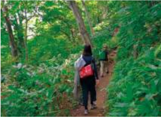
การเดินทางป่ามารุยามะ