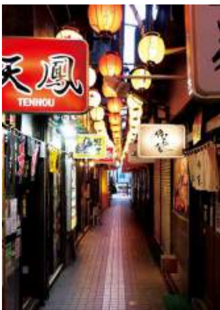
ซัปโปโร มิโอะราเมง