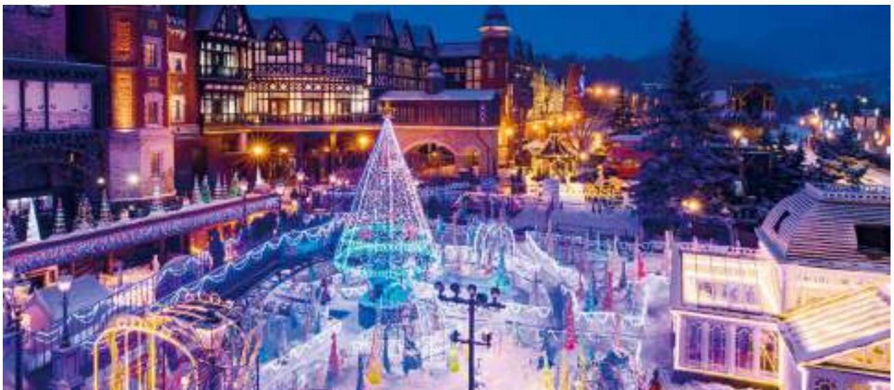
ซีโรอิคอบิตะ ปาร์ค