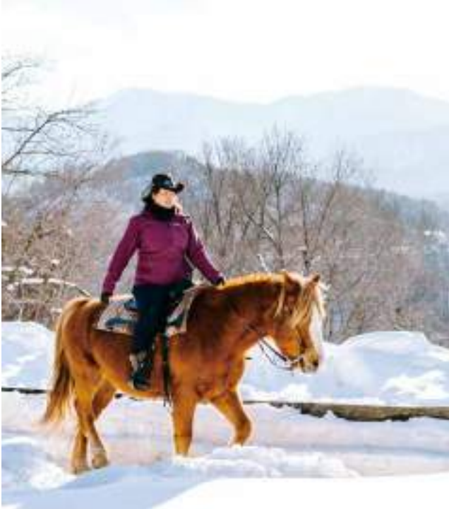
กิจกรรมขี่ม้า