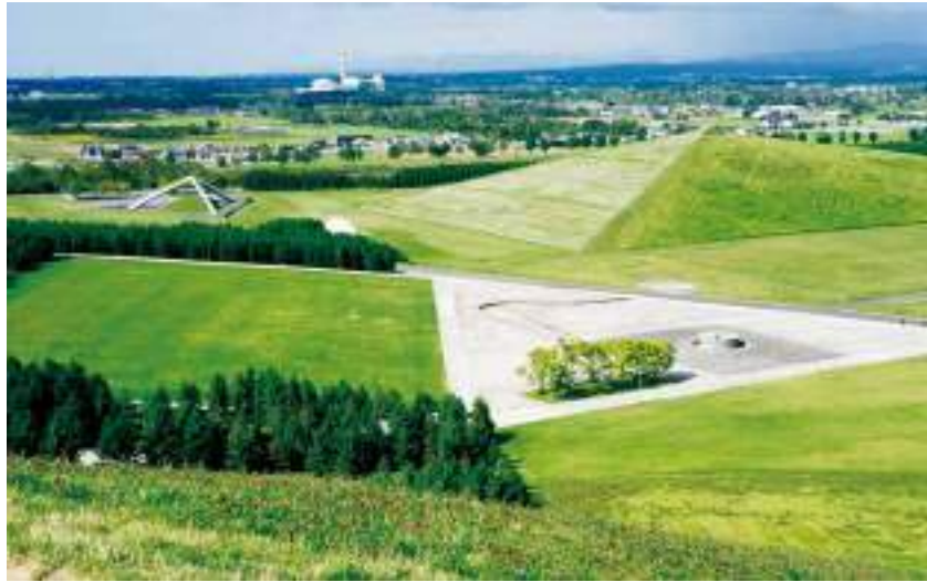
สวนสาธารณะโมเอเรนูมะ