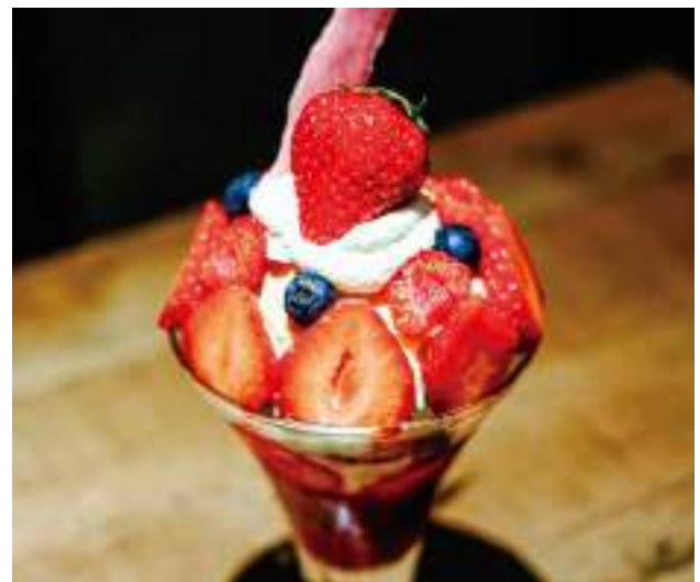
ชิเมะ พาเฟต์