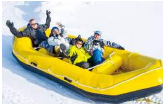
กิจกรรมหิมะ