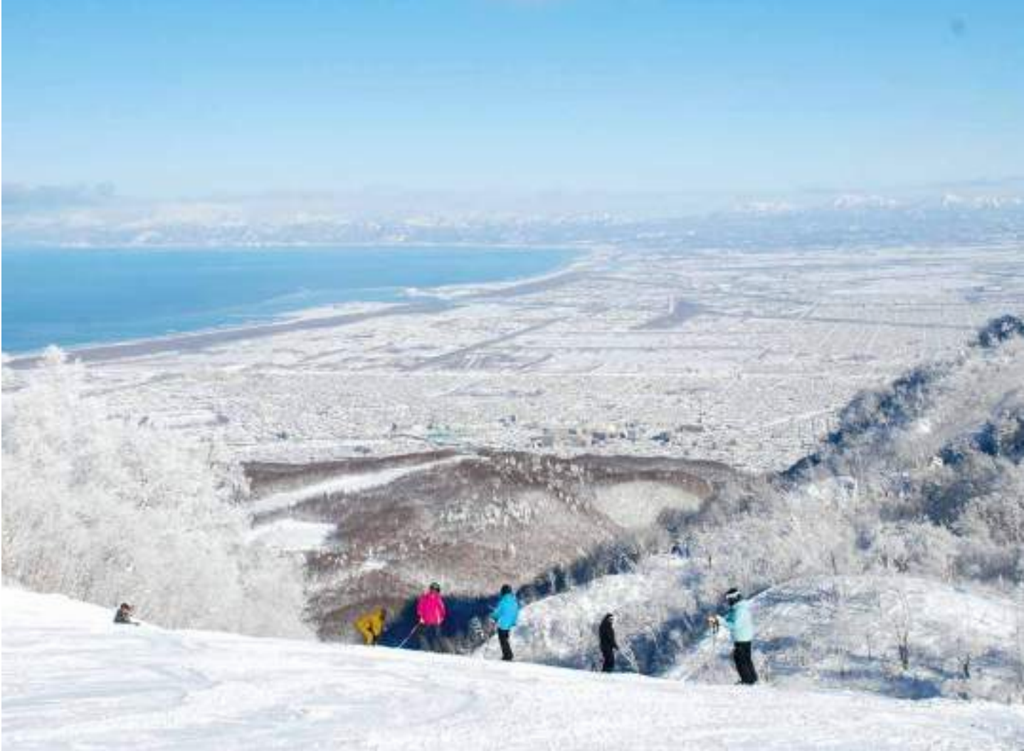
ซัปโปโรเทเนะ