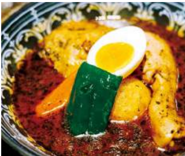
ซูปแกงกะหรี่