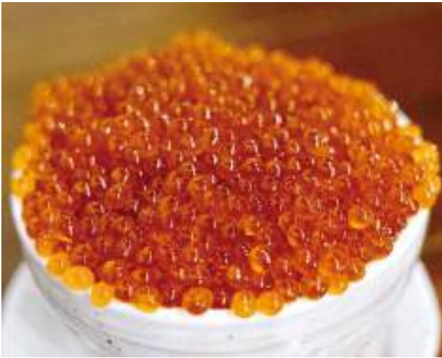
อาหารทะเล