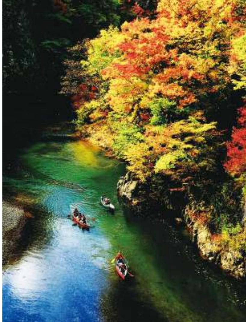
ล่องแก่งโจซังเค