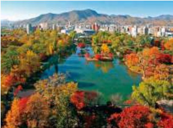
สวนสาธารณะนาคาจิมะ