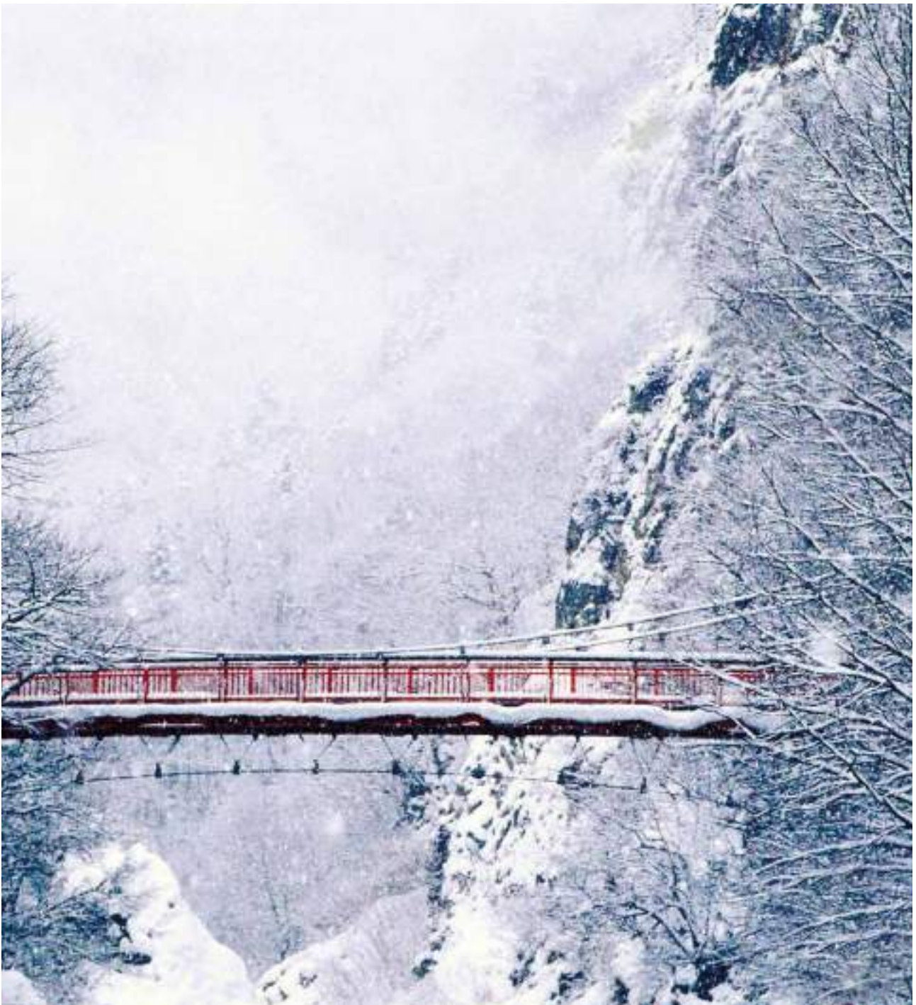
โจซังเคอนเซ็น