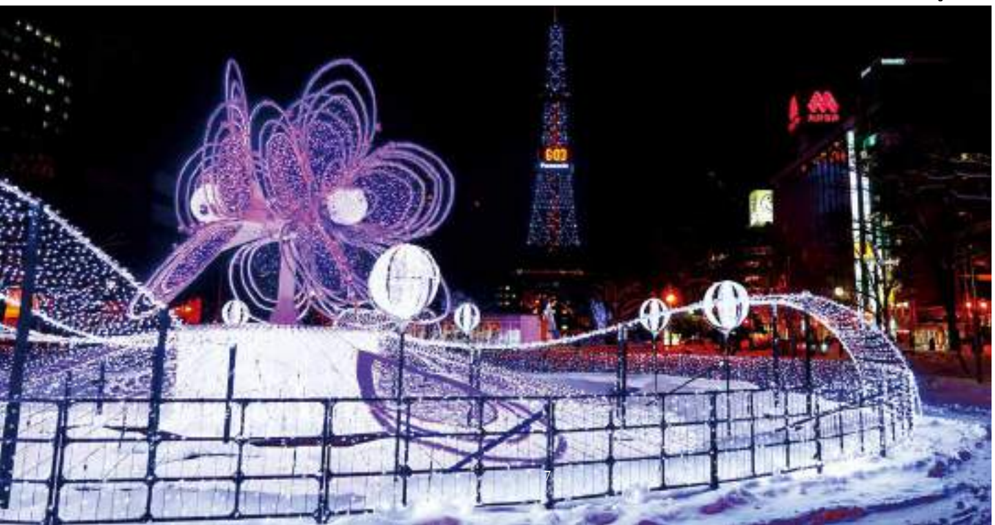
ขับไปโร ไวท์ อิลลูมินชัน