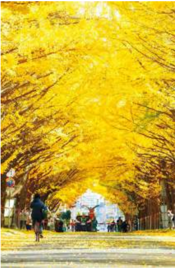
มหาวิทยาลัยฮอกไกโด