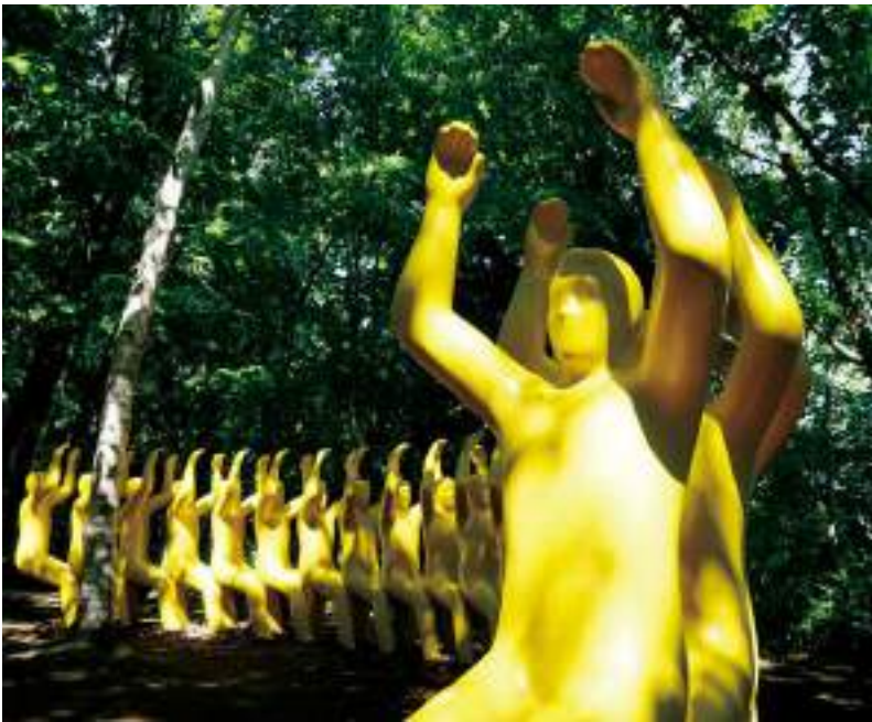
สวนศิลปะซัปโปโร