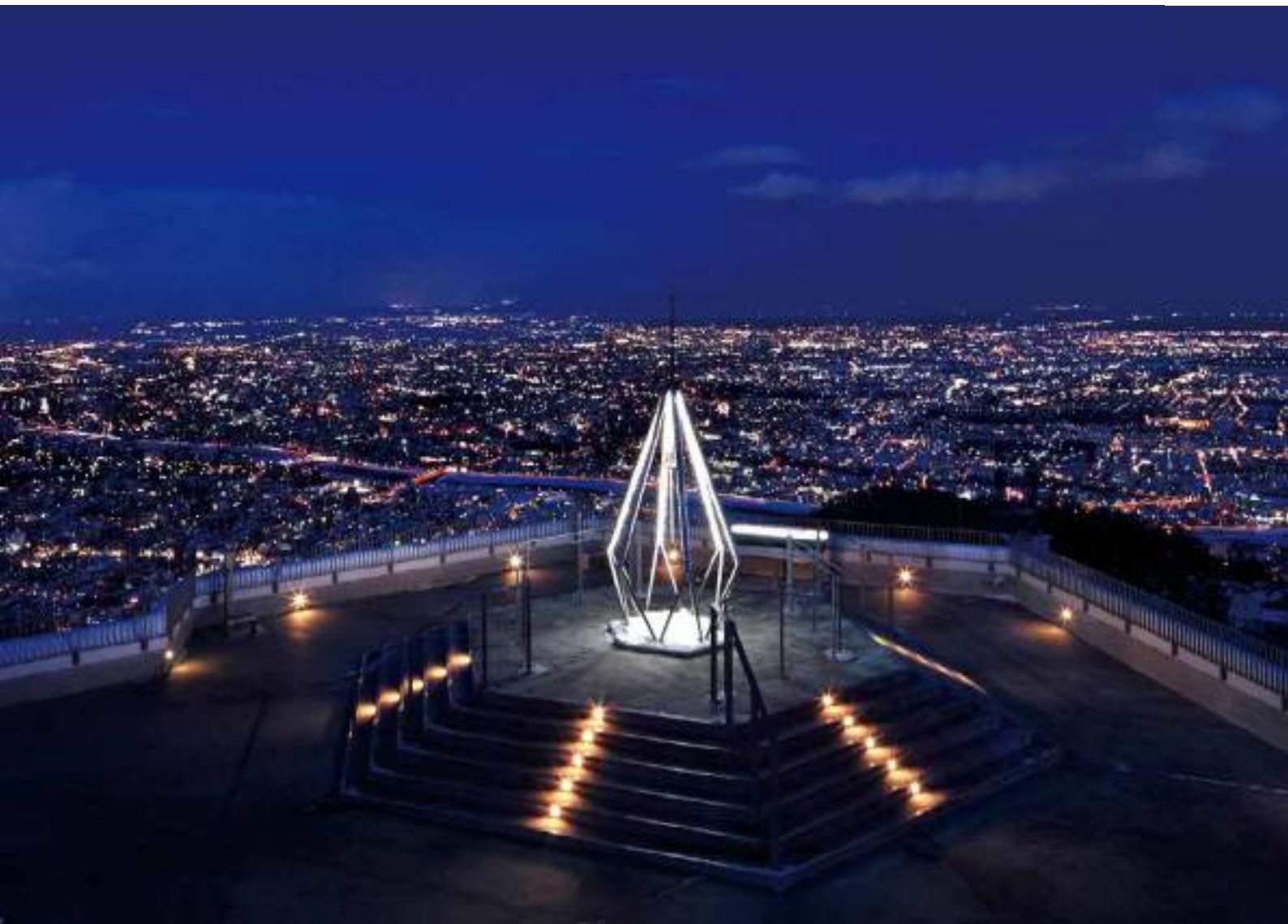
ภูเขาโมอิวะ