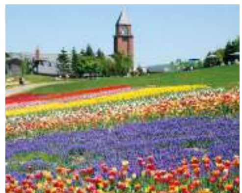
ทาคิโนะ ชูซุรัน ฮิลล์ไซด์ เนชั่นแนลพาร์ค