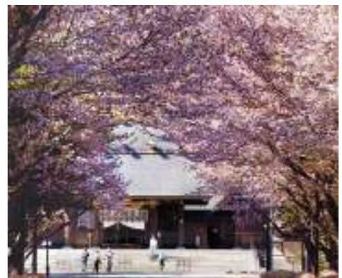
ศาลเจ้าฮอกไกโดจินกู