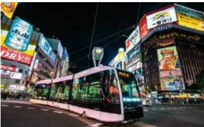
ชูชูกินะ