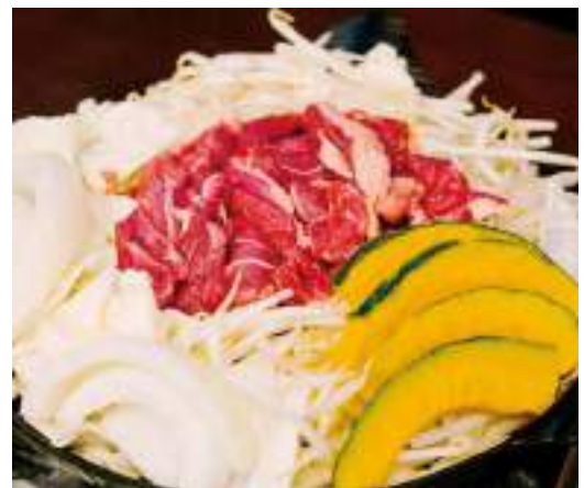
พิพิธภัณฑ์เบียร์ซัปโปโร / ลานเบียร์ซัปโปโร