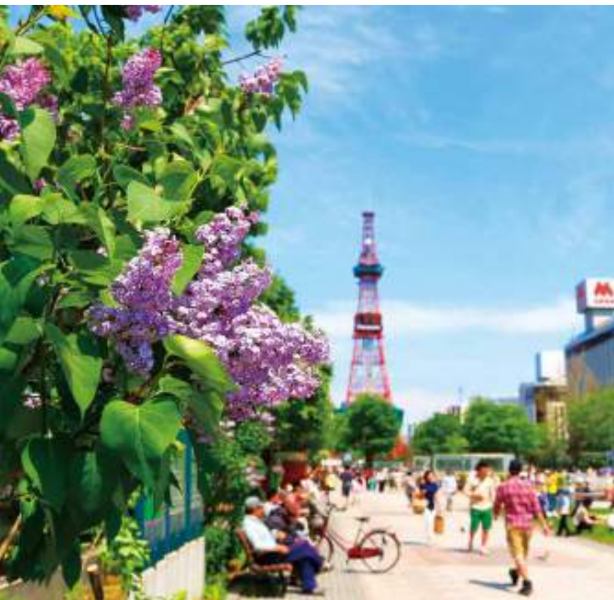
สวนสาธารณะโอโตริ