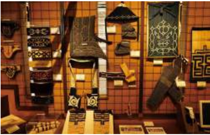
ซัปโปโร พิพิธภัณฑ์โคะตัน (ศูนย์แลกเปลี่ยนวัฒนธรรมไอนุ ซัปโปโร)