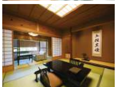
โจซังเคอนเซ็น