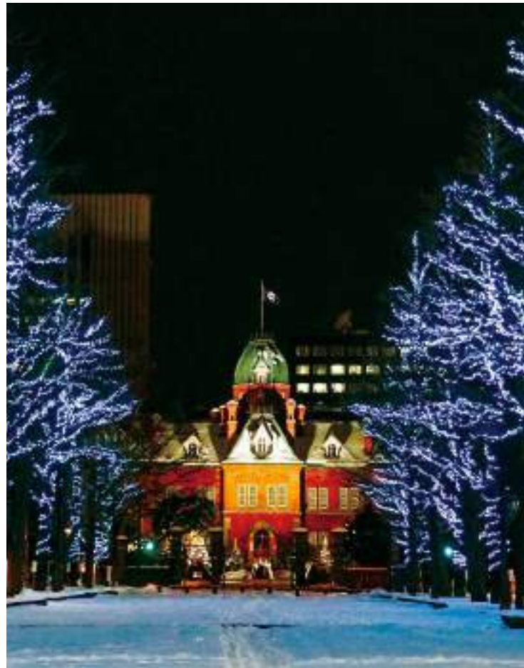
ศาลาว่าการเมืองฮอกไกโดหลังเก่า